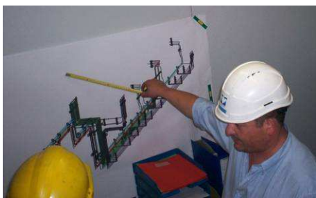
6 Réalisation du dossier technique et notice d'instructions

Les tuyauteries étaient prémontées pendant la préparation du chantier afin de gagner du temps pendant l'arrêt de production.